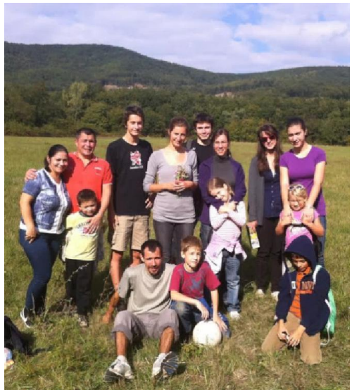
(Képünk egy korábbi kiránduláson készült)

Ha visszagondolok erre a napra, úgy látom, hogy Isten nagyon megáldotta azt, hiszen nagyon békésen telt, a gyerekek is és mi is jól éreztük magunkat, tudtunk együtt figyelni Istenre, és kicsit többet megérteni abból, hogy ő milyen hatalmas és milyen jó Isten.